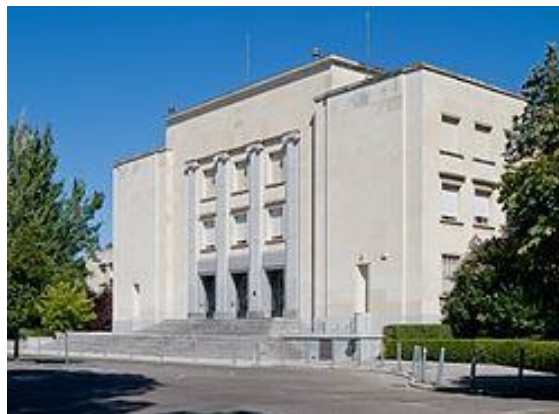
Architecture school. Polytechnic University of Madrid. Avenida Juan Herrera, 4. Madrid