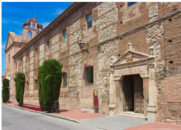
Architecture school. University of Alcalá. Santa Ursula, 8. Alcalá de Henares, Madrid

Training School has two locations, which can change if sanitary restrictions (covid-19) require it.